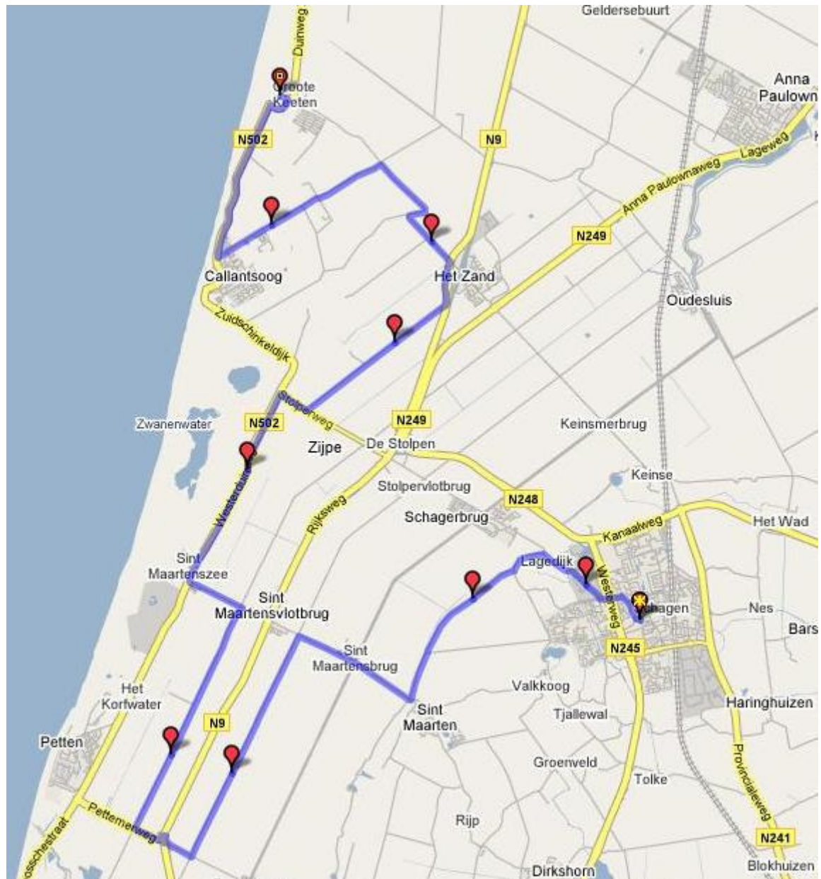
Figuur 1: Deel 1 Schagen - Groote Keeten